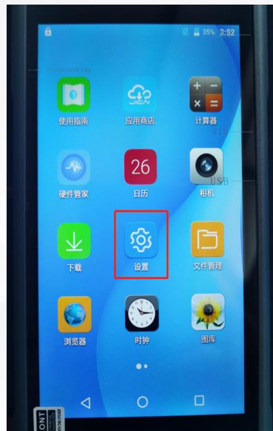
点击设置设置网络