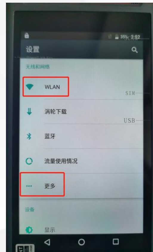
设置无线WiFi或者4G网络