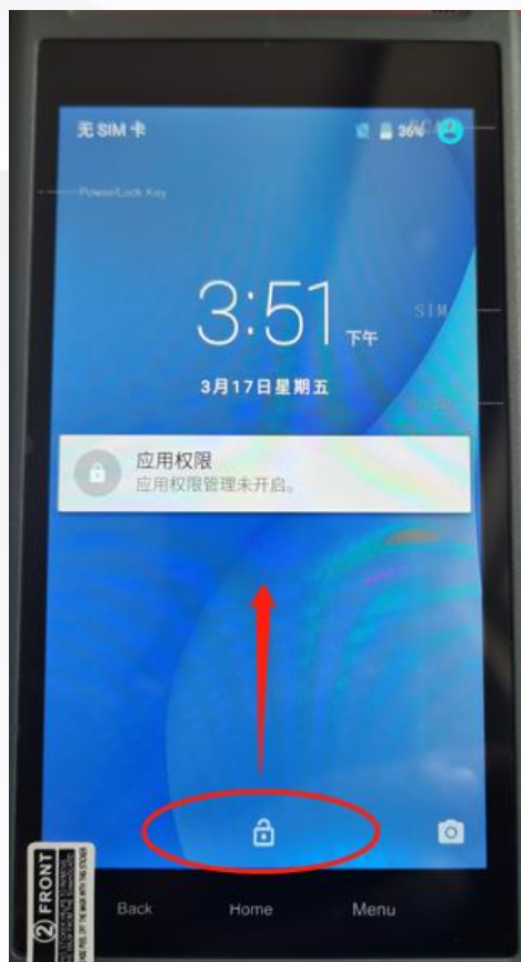
开机后向上滑动解锁